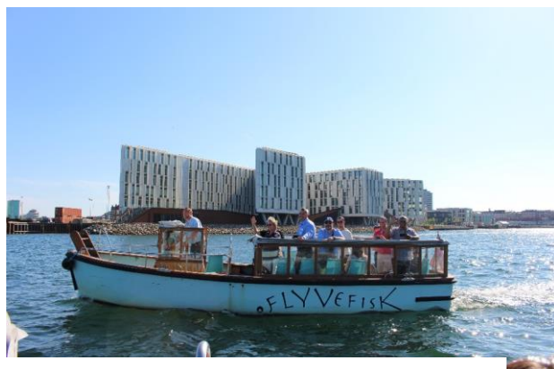
Copenhague - Danemark